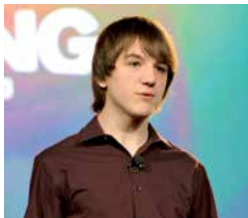
Jack Andraka im Jahr 2013

nicht nur aufgrund von Jack Andraka zu einem heißen Thema im wissenschaftlichen Diskurs geworden. Den Grundgedanken dahinter fasst Robert Darnton, Leiter der Harvard Library, zusammen: »Wissen ist ein öffentliches Gut. Natürlich kosten auch öffentliche Güter Geld, aber sie sollten der Öffentlichkeit frei zur Verfügung stehen« 2 . So hat auch die EU in ihrem derzeitigen Rahmenprogramm für Forschung und Innovation »Horizon 2020« festgeschrieben, dass alle Publikationen, die aus den geförderten Projekten resultieren, frei zugänglich sein müssen. Österreich nimmt auf dem Gebiet von Open Access eine Vorreiterrolle ein: Im eigens dafür gegründeten Open Access Network Austria (OANA) wird das Thema unter der Schirmherrschaft des Wissenschaftsfonds FWF und der Österreichischen Universitätskonferenz Uniko von Vertreter/innen aus 49 Institutionen bearbeitet. Der FWF hat für Open Access mit drei Mio. Euro in den Jahren 2013 und 2014 einen der höchsten Budgetanteile einer Förderorganisation weltweit.